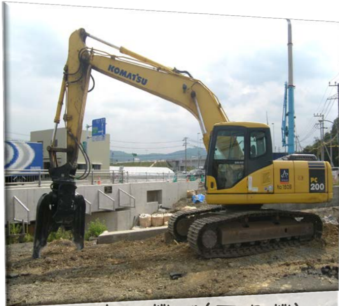
使用機械(圧砕機) 0.7m 3 バックホウ