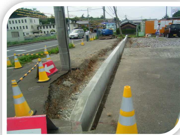
コマ止めブロック完了