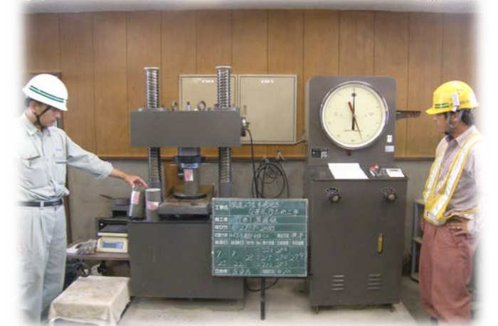
コンクリート品質管理 圧縮強度試験