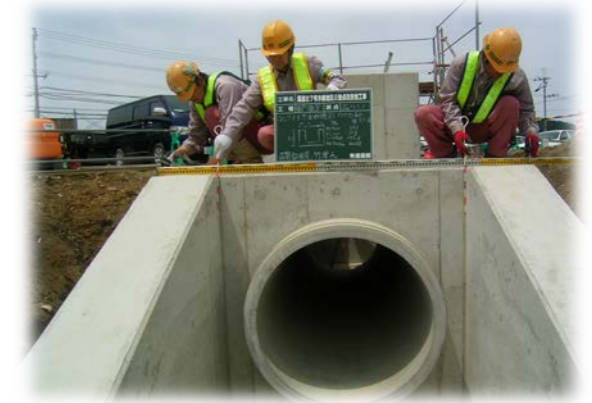
樋門・樋管出来形確認 確認者：品質証明員 竹澤土木部長