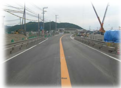
迂回路部嵩上工施工前