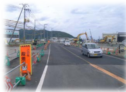
迂回路部嵩上げ工施工途中段階 (5層嵩上げ)