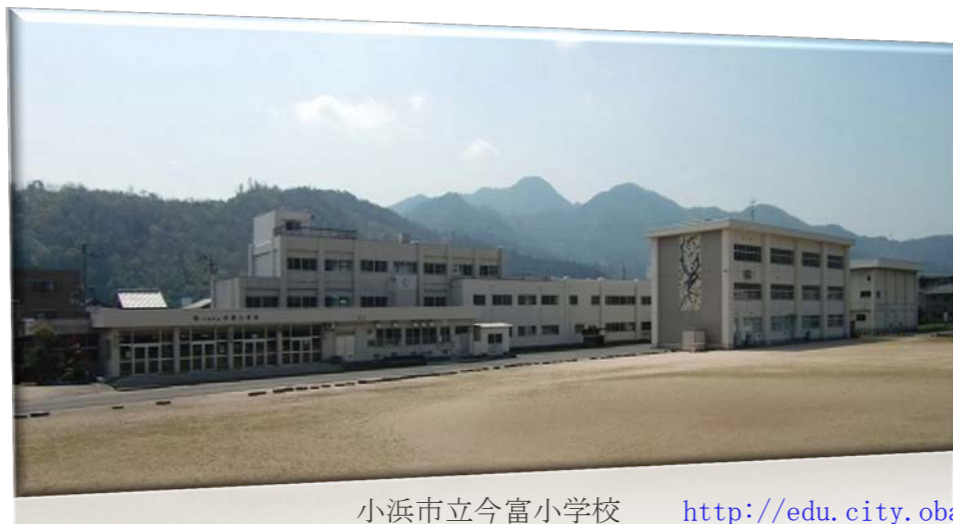
小浜市立今富小学校 http://edu.city.obama.fukui.jp/imatomi/